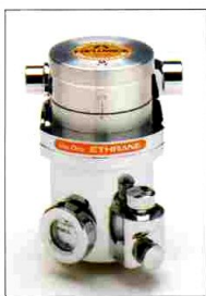
エンフルウィックTYPE100