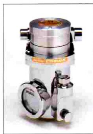
エンフルウィックTYPE200