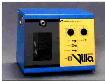
麻酔用ベンチレーター“Villa”